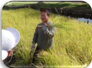
【稲刈り～奥山農園さん】