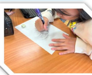
【イラストレーター】