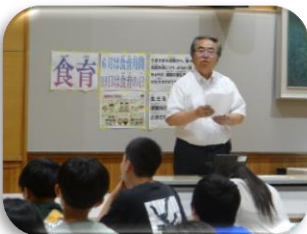
【木村エンジニアリングさん】