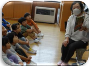
【読み語りボランティアの皆様】