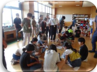
【主任児童員・民生児童委員の皆様】